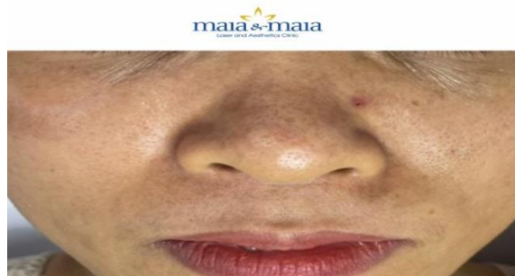
XÓA NẾP NHĂN BẰNG IPL