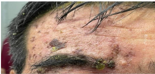
ĐIỀU TRỊ ĐAU DO ZONA BẰNG CHIẾU LASER HÉ-NÉ