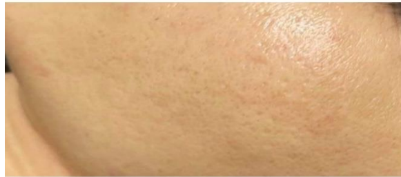
ĐIỀU TRỊ SẸO LỖM BẰNG TCA