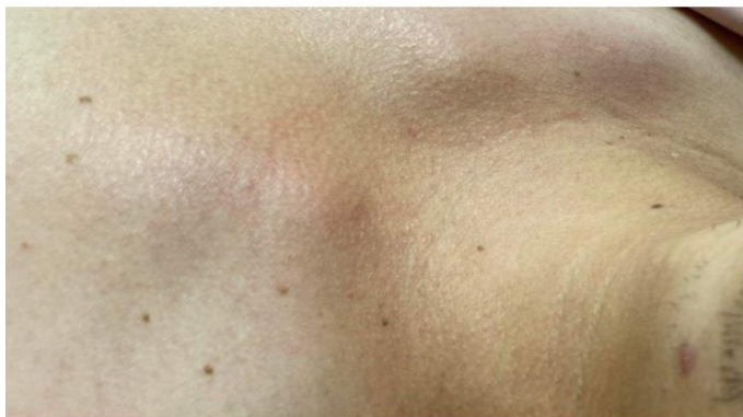
ĐIỀU TRỊ U MỀM TREO BẰNG ĐỐT ĐIỆN