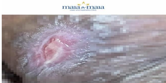
ĐIỀU TRỊ SÙI MÀO GÀ BẰNG LASER CO 2

- Công nghệ Laser CO 2 là kỹ thuật sử dụng chùm tia Laser CO 2 nhằm loại bỏ tổ chức tổn thương.