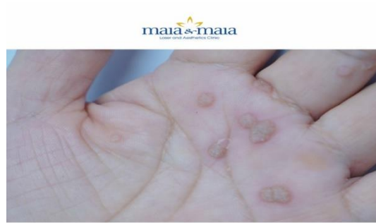
ĐIỀU TRỊ HẠT CƠM BẰNG NITƠ LỎNG