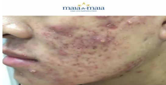
ĐIỀU TRỊ MỤN TRỨNG CÁ BẰNG CHIẾU ĐÈN LED