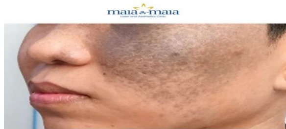
ĐIỀU TRỊ BỚT TĂNG SẮC TỐ BẰNG YAG-KTP