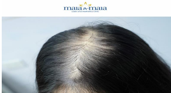
ĐIỀU TRỊ RỤNG TÓC BẰNG TIÊM TRIAMCINOLON DƯỚI DA