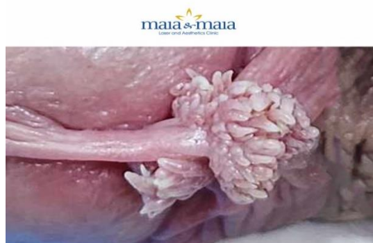
ĐIỀU TRỊ SÙI MÀO GÀ BẰNG PLASMA

- Bác sĩ chuyên khoa Da liễu trực tiếp thực hiện.